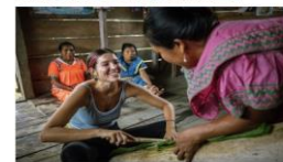
“Panamá se consolida como pioneiro no turismo sustentável”