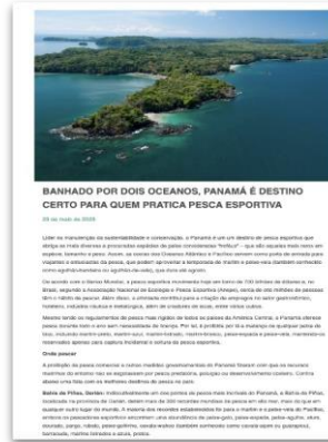
“Banhado por dois oceanos, Panamá é destino certo para quem pratica pesca esportiva”