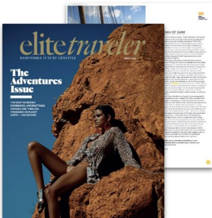
“Mares el día” (Print Coverage)

42 publicaciones en medios Alcance de 41.3M usuarios