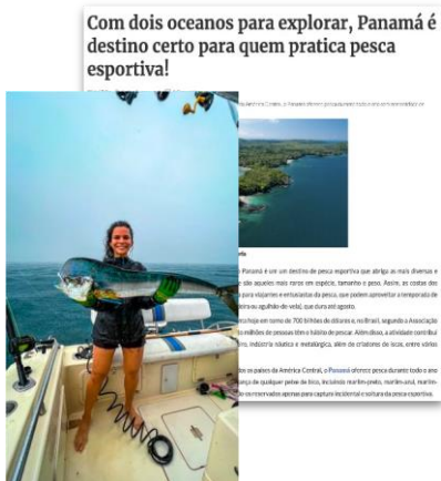
“Com dois oceanos para explorar, Panamá é destino certo para quem pratica pesca esportiva!”